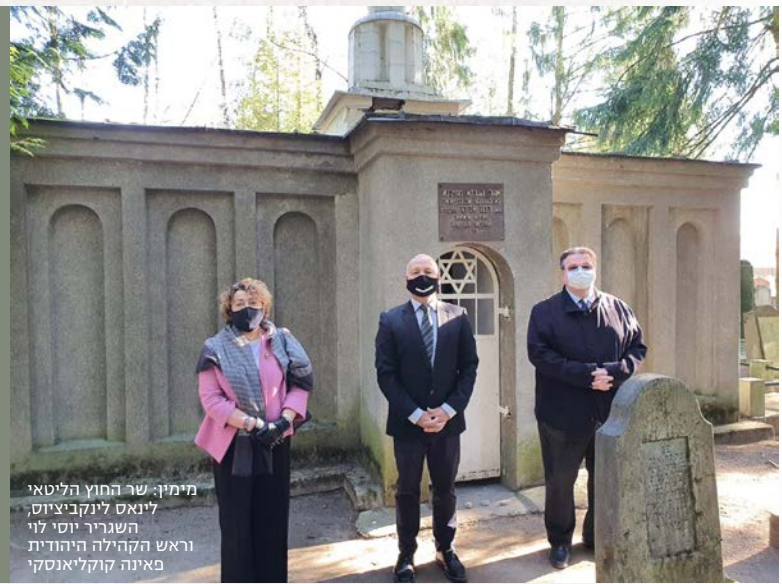
מימין: שר החוץ הליטאי לויאס לינקוביץ, השגריר יוסף לוי ראש הקהילה היהודית פאינה קוקליאנסקי

יום הולדת ליטאי לגאון מטבע בעברית, כנס ליטווקים ומענקים ליוצרים: כך תכננו לחגוג בליטא 300 שנים להולדת הגאון מווילנה